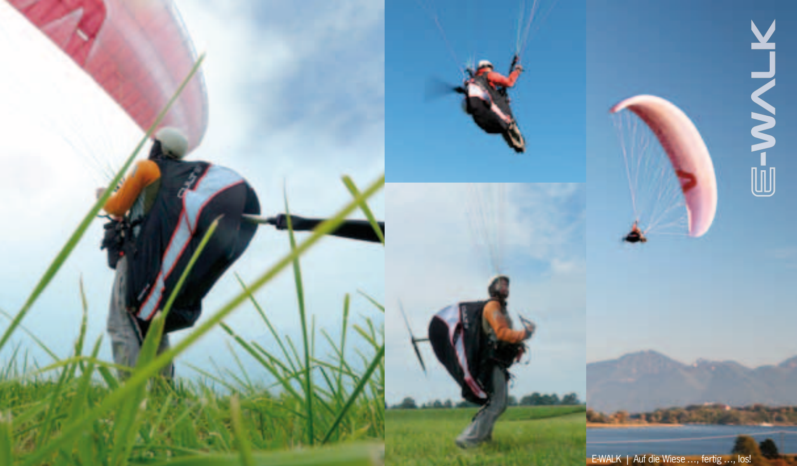
E-WALK | Auf die Wiese ..., fertig ..., los!