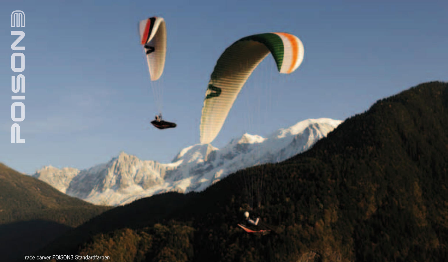
race carver POISON3 Standardfarben