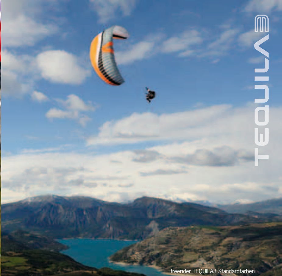
freerider TEQUILA3 Standardfarben