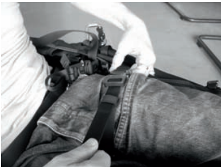
Umfangeinstellung der Beinschlaufen

Beinschlaufenumfangs geschieht durch verstellen der Beinschlaufenlängen. Die Beinschlaufenlänge wird unter der Sitzfläche eingestellt. Achten Sie hier bitte auf eine symmetrische Einstellung.