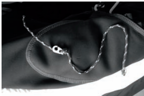
Brummelhacken des Fußbeschleunigers